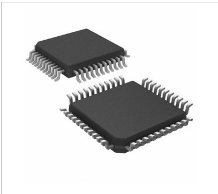
Bild kann Representatioun sinn. Kuckt Spezifikatioune fir Produktdetailer.