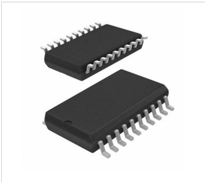
Bild kann Representatioun sinn. Kuckt Spezifikatioune fir Produktdetailer.